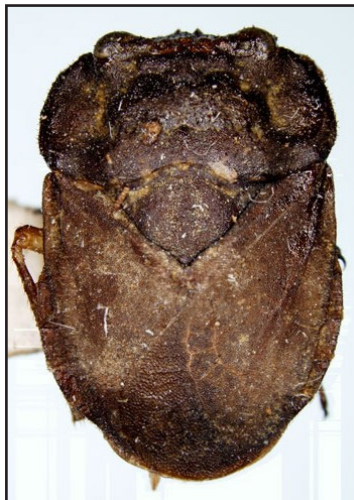
Fig. 1. Gelastocoridae. Nerthra ranina (Herrich-Schaeffer), vista dorsal.

Fue reconocida inicialmente por Billberg (1820) y nominada sobre la base de Galgulus Latreille como Galgulides. Posteriormente, Kirkaldy (1897) consideró a Galgulus como homónimo posterior, reemplazándolo por Gelastocoris Kirkaldy. La utilización del nombre Galgulides por autores contemporáneos es rechazada sobre la base del art. 39 del Código Internacional de Nomenclatura Zoológica (Menke, 1979a). También se la ha nombrado como Mononychidae y Nerthridae (Costa Lima, 1940).